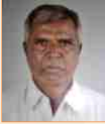
છગનલાઈ ભયુલાઈ લીલ