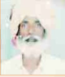
વેલાલાલ ઘનાલાલ લીલ ગઢડા - ખડીર : ભજનિક આરાધીવાણી - ભજન