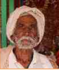
મલુલાલ હમીરલાલ લીલ ઘાણેટી-ભુજ : સંતવાણી - ભજન