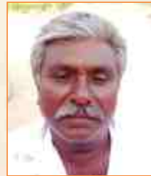
પચાણલાઈ રવાલાઈ લીલ