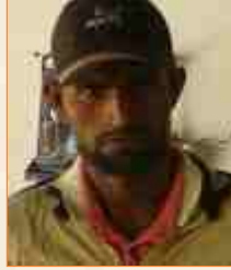
ઘનજલાલ ભુરાલાલ લીલ બાદરગઢ-રાપર : રાસડા - ઠાંકિયારાસ