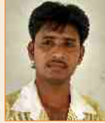
બાબુલાઈ નાથાલાઈ લીલ

ચાંપાર - ભચાઉ - ભજન - દુહાઈદ આતમવાણી - ગુરૂવાણીના લેખક