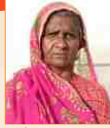
જીમીબેન માલાલાઈ લીલ