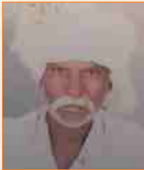
મોહનલાઈ પાલાલાઈ લીલ