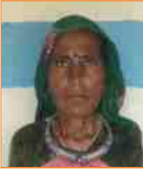
આસીબેન લીજાલાઈ લીલ