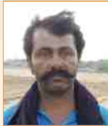
ઘનજલાલ દેવાલાલ લીલ સરસપુર - ભુજ : સીંધી કલામ - આરાધીવાણી