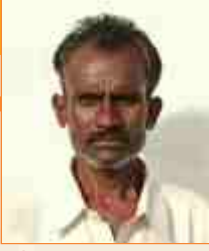
વેરશીલાઈ માલાલાઈ લીલ