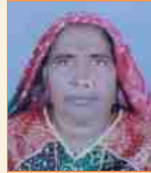
બબીબેન રણોડલાઈ લીલ