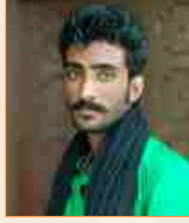
સવજલાલ સામજલાલ લીલ ચાંપાર (ખડીર) : સીંધી કલામ - આરાધીવાણી