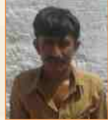
ઘનજલાલ જોંગારલાલ લીલ સરસપુર : ભુજ : સીંધી કલાક - આરાધીવાણી